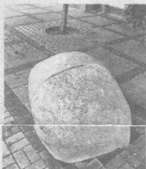
Passgenau ins Pflaster vor der Sparkasse gelassen: Wolfgang Völkers „Wollsack“.