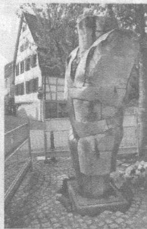
Uli Lamps „Torso“ steht in der oberen Bachgasse.

lärmenden Jugendlichen, die sich an dem einladenden Platz, in den die Schlossparkstraße mündet, treffen könnten. Verschwendung kommunaler Mittel ist eine weitere Sorge. Grundlos, wie der Bauhofleiter erklärt: „Viele haben noch nicht ver-