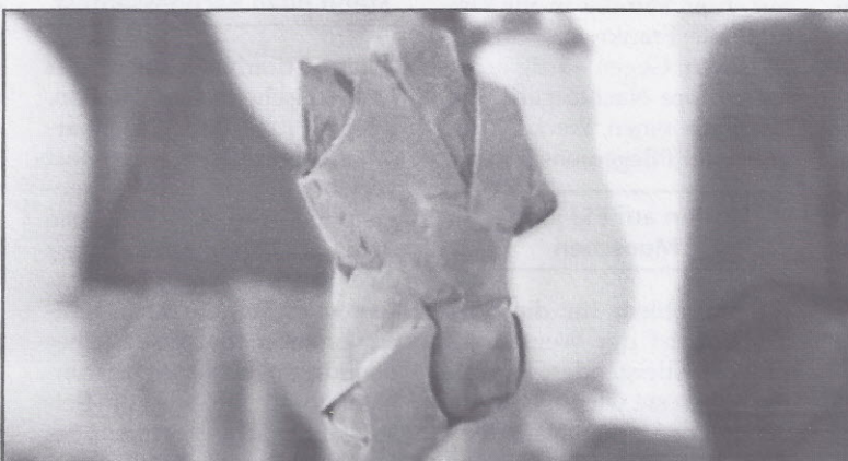
Torso von Uli Lamp