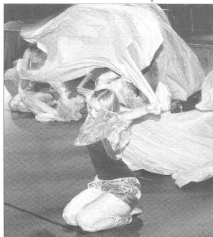
Eine Augenweide bei See der Sinne wird sicherlich wieder die Tanzvorführung

Es sei noch darauf hingewiesen, dass am Donnerstag und Freitag vor „See der Sinne“ nur ein eingeschränkter Badebetrieb möglich ist. Am Tag der Veranstaltung bleibt der Badebetrieb geschlossen. Einen ganz besonderen Dank möchten die Organisatoren